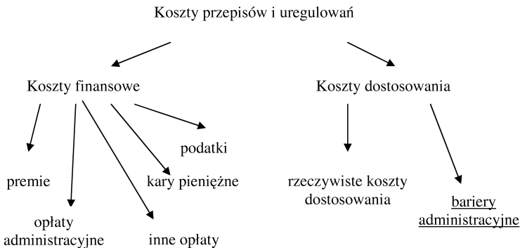
Rys. 2. Koszty zachowania zgodności z przepisami i regulacjami

Badanie skali występujących barier administracyjnych jest bardzo skomplikowanym problemem. Podmioty gospodarcze zazwyczaj mają wiele różnych, także pośrednich metod i sposobów na dostosowanie swojej działalności do nowych regulacji. Poza tym, wiele obowiązków nakładanych przez różne regulacje i tak musiałoby być realizowanych, nawet gdyby nie było takiego obowiązku. Bywają również sytuacje, w których dzięki określonym obowiązkom nałożonym na firmy przez państwo nie muszą one ponosić dodatkowych kosztów, które byłyby niezbędne, gdyby nie było takich rozwiązań prawnych. Tego rodzaju sytuacja ma miejsce, gdy spełnienie wymogów nałożonych przez regulację prawną daje konsumentom gwarancję jakości produktu czy usługi.