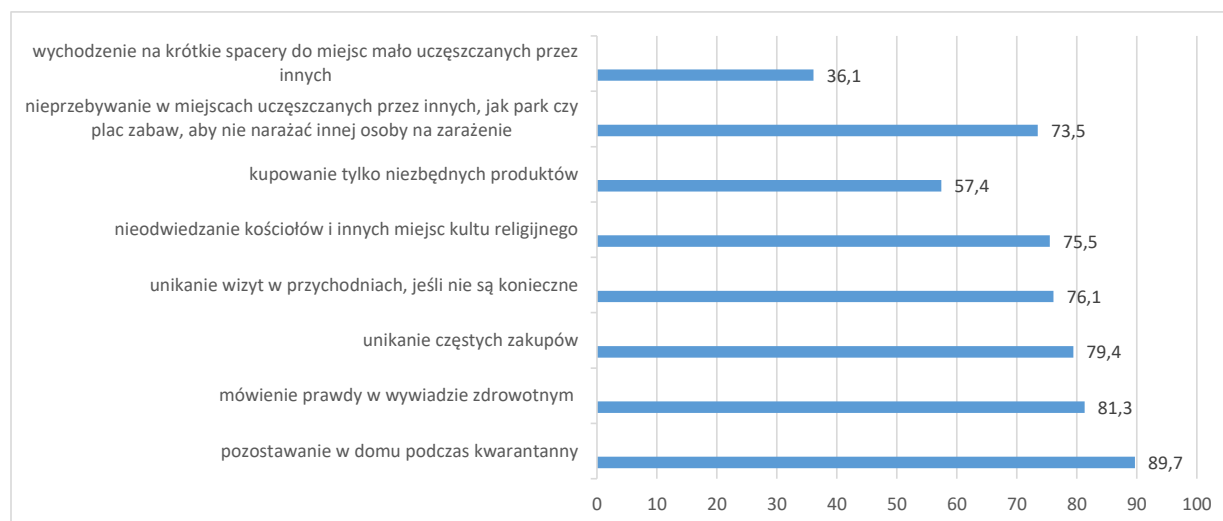
Wykres 1. Troska o dobro wspólne w sytuacji epidemiologicznej, w procentach

W opinii respondentów troska o dobro wspólne w trwającej sytuacji epidemiologicznej objawiała się przede wszystkim pozostawaniem w domu podczas kwarantanny domowej (89,7%). Warto zauważyć, że mimo kar pieniężnych – nawet do 30 tysięcy złotych za jej nieprzestrzeganie (INFOR, 2020) – są nadal osoby, które potencjalnie narażają innych na chorobę czy nawet śmierć. Policja potwierdza, że powodami łamania przepisów są między innymi chęć wyjścia na spacer, zorganizowanie imprezy czy chęć wyjazdu do Wielkiej Brytanii w celach zarobkowych (Policja.pl, 2020).