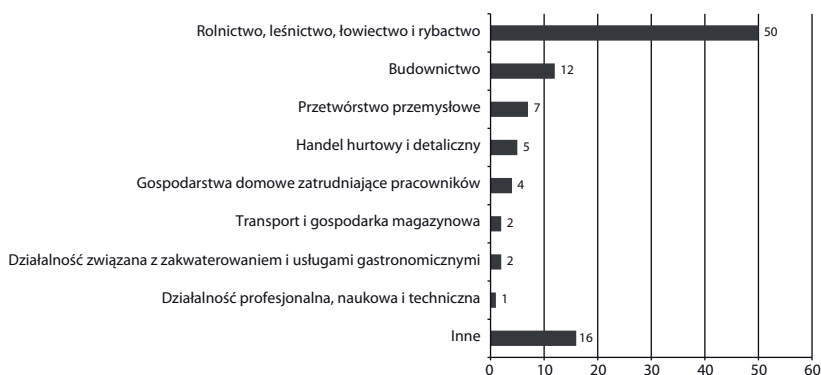
Wykres 3. Struktura zatrudnienia Ukraińców według branż w 2013 r.