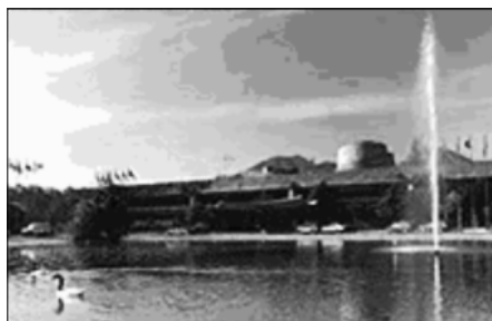
Fot. 1 Siedziba CEPAL. Budynek ONZ zaprojektowany przez Emilio Duharta, oddany do użytku w 1966 roku.