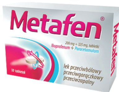
Rys. 2. Opakowanie leku Metafen (producent: POLPHARMA)

Analiza korpusu badawczego wykazała, że obie subpłaszczyzny, z których pierwsza operuje tylko elementami językowymi, a druga – elementami obrazowymi, mogą także dysponować swoimi wtórnymi subpłaszczyznami. W przypadku opakowania leku Metafen (rys. 2) można odnaleźć wtórną subpłaszczyznę tekstu, dzięki której przywołane są najpierw dwa główne składniki leku (tzn. ich nazwa oraz zawartość w mg), a poniżej także informacje odnośnie do działania leku. Warto zauważyć, że właśnie te dane umieszczone są w bezpośrednim sąsiedztwie subpłaszczyzny obrazu, przez co wpływają także na odbiór tego, co obrazowe (naturalny kierunek czytania tekstu od góry do dołu i od lewej do prawej może uzasadniać początkowe skupienie wzroku na subpłaszczyźnie tekstu, a następnie płynne przeniesienie go na subpłaszczyznę obrazu i wtórną subpłaszczyznę tekstu). Towarzyszy temu następujący obrazowy akt mowy : Metafen to lek w kapsułkach, które są tu zaprezentowane, i który działa przeciwbólowo, przeciwgorączkowo i przeciwzapalnie 11 .