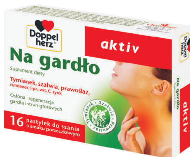
Rys. 5. Opakowanie leku Doppelherz Aktiv Na gardło (producent: QUEISSER)