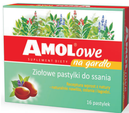
Rys. 7 Opakowanie leku AMOLowe na gardło (producent: TAKEDA)

W przypadku wyżej zaprezentowanego opakowania leku (rys. 7) zastosowano jeszcze jeden, interesujący zabieg z zakresu mikrotypografii. Oto nazwa handlowa leku AMOL , pod którą dotąd kryły się sprzedawane w charakterystycznych butelkach krople ziołowe, została dostosowana do wymogów nowego produktu, jakim są pastylki do ssania. Na opakowaniu owych pastylek nazwa handlowa AMOL , tworząca subpłaszczyznę tekstu, została rozszerzona o sufix -owe oraz korespondujący z nim dopisek na gardło . Dzięki zastosowaniu różnych stylów pisma udało się zachować dotychczasowy zapis nazwy handlowej leku (litery drukowane), płynnie wkomponowując w niego sufix -owe i tworząc w ten sposób przymiotnik odrzeczownikowy: Amolowe .