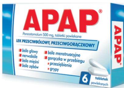
Rys. 3. Opakowanie leku APAP (producent: US PHARMACIA)

W przypadku analizowanego korpusu istotny jest każdy z opisanych przez Stöckla obszarów typograficznych. Prezentowane poniżej opakowania leków dowodzą, że nawet drobne zmiany o charakterze typograficznym powodują, że zmienia się płaszczyzna wizualna, a w efekcie odbiorca ma do czynienia z nowym komunikatem. Można to zaobserwować na przykładzie dwóch opakowań leku APAP : w wersji standardowej (rys. 3) i w wersji na noc (rys. 4).