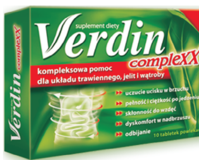
Rys. 6. Opakowanie leku Verdin complexx (producent: LE LABORATOIRE DE LA NATURE)

Także w przypadku leku Verdin complexx (rys. 6) można zaobserwować szereg rozwiązań typograficznych, które wpływają na percepcję potencjalnego odbiorcy. Także w tym przypadku kolor zielony stanowi nawiązanie do składu leku. Podobną rolę pełni również element mikrotypograficzny, jaki zastosowano w nazwie handlowej leku: litera V jest stylizowana w taki sposób, by jej prawy element przypominał liść. Subpłaszczyzna obrazu ma na celu informację o obszarze działania leku. Inaczej niż w przypadku poprzedniego opakowania (rys. 5) tutaj to obraz ludzkiego tyłowiawia pojawia się jako pierwszy z lewej, a tuż za nim można znaleźć wyszczególnione opisy sytuacji, w których można i należy zastosować omawiany lek. Rolę pośrednika między subpłaszczyzną obrazu a tą