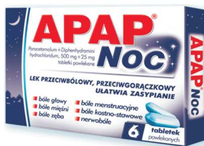
Rys. 4. Opakowanie leku APAP Noc (producent: US PHARMACIA)