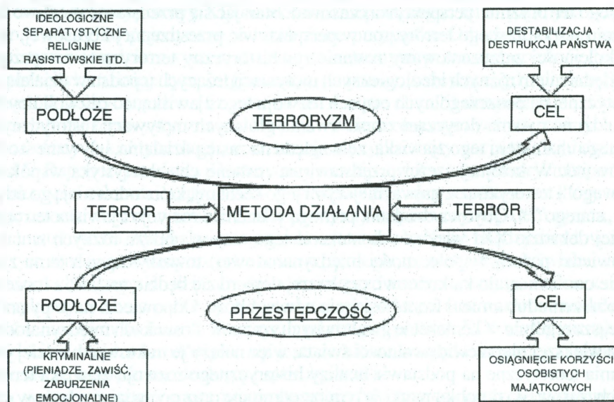
Rys. 1. Terroryzm a przestępczość zorganizowana – schemat definicyjny

Źródło: K. Jałoszyński, Organy administracji rządowej wobec zagrożeń terrorystycznych. Policja w walce i przeciwdziałaniu terroryzmowi, Bielsko-Biała 2009, s. 14.