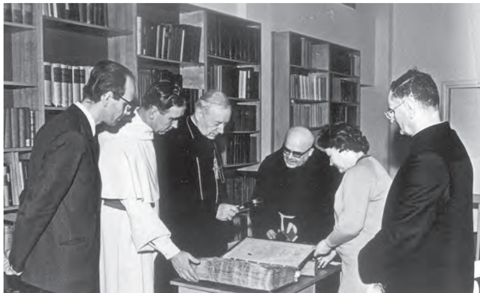
Fotografia 2. O. Romuald Gustaw i o. Mieczysław A. Krąpiec pokazują kardynałowi Stefanowi Wyszyńskiemu skarby Biblioteki Uniwersyteckiej KUL.

klasztoru o kolejne lata 63 . Jest to wszechstronna monografia dziejów konwentu krakowskiego, przedstawiająca jego przeszłość organizacyjną, życie wewnętrzne, uposażenie, dzieje budowy i wyposażenia budynków klasztornych i kościoła. Przedstawiony w niej model życia zakonnego daje dobre wyobrażenie o funkcjonowaniu żeńskich konwentów bernardyńskich 64 . Profesor Stanisław Herbst uznał rozprawę za wzorcową, cechującą się gruntowną kwerendą archiwalną, krytycyzmem i dojrzałością osądu 65 .