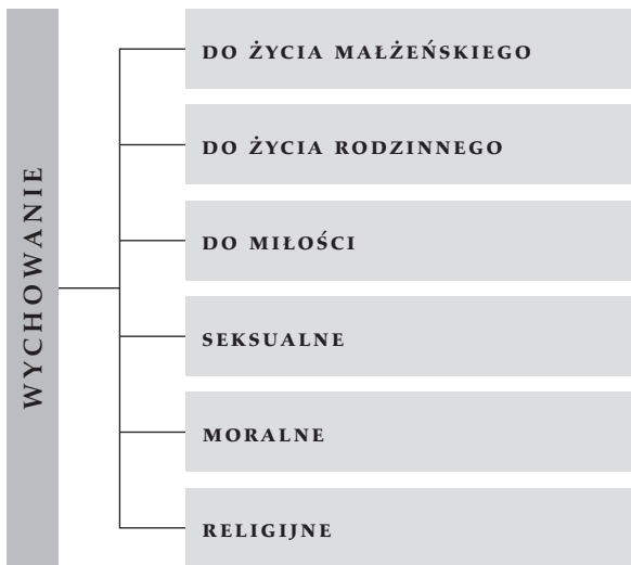
Rysunek 1. Kierunki wychowania.

Rodzina jest wspólnotą osób, w której dokonuje się wychowanie. Wymaga się w niej, aby dziecko przystosowane było do środowiska rodzinnego, ale także do tych wszystkich środowisk, grup i kręgów społeczno-kulturowych, w których w przyszłości będzie żyło, funkcjonowało czy podejmowało pracę.