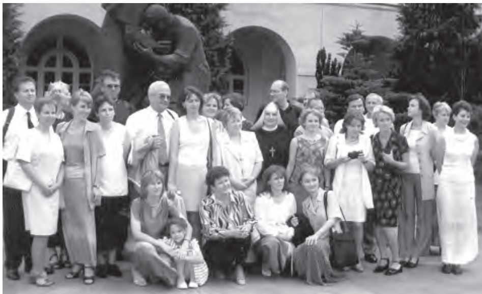
Fotografia 2. Zjazd absolwentów z rocznika s. Martyny, dziedziniec KUL, sierpień 2002.

Gdy po latach otworzyłam indeks, byłam zdumiona bogactwem wykładów i ćwiczeń, które mieliśmy na studiach i dopiero z perspektywy czasu potrafię docenić wartość zdobytej wiedzy i doświadczeń, jakie przeżyłam.